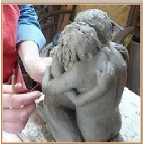
Un exemple d'œuvre d'Anne-Claude Favé